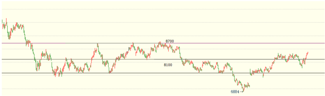
(棕榈油主力 01 合约 1h 图)