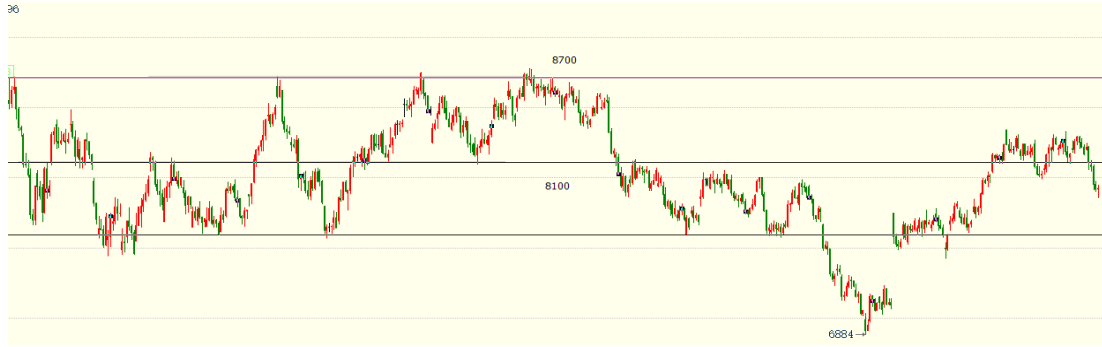
（棕榈油主力 01 合约 1h 图）