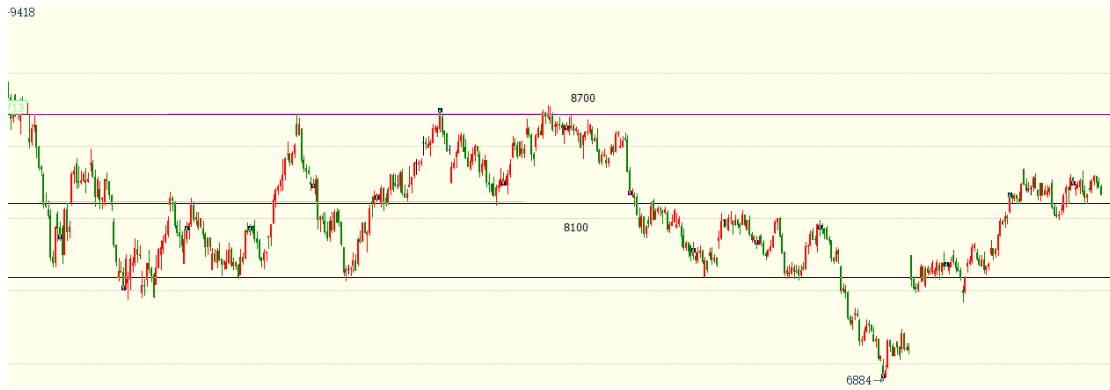
（棕榈油主力 01 合约 1h 图）