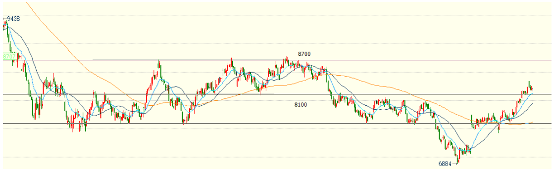
(棕榈油主力 01 合约 1h 图)