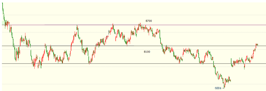
（棕榈油主力 01 合约 1h 图）

产区方面，供应端，东南亚增产季遭遇洪涝，增产推进有难度。印尼的低价出口政策以使胀库问题得到根本缓解，而印尼激进的出口政策尚未转向，进一步下调出口价格与马来竞争需求，当前价格优势仍掌握在印尼手中。需求端，据Mysteel调研显示，预估2022年11月全国棕榈油到港量50万吨左右，买船需求维持高位，在印度与中国的需求支撑下，预计印尼9、10月份库存维持回落态势，短期出口回落或在天气原因。在消费国完成库存建立以及需求释放后，中长期需求或面临回落。在增产季下，马来、印尼近期争相供应偏松预期是否会很快迎来转变仍有待观察。增产旺季后棕榈油即将迎来季节性减产，产量下降或将推动库存进一步下降，棕榈油供应最宽松的阶段或已结束，中长线利多油脂板块。