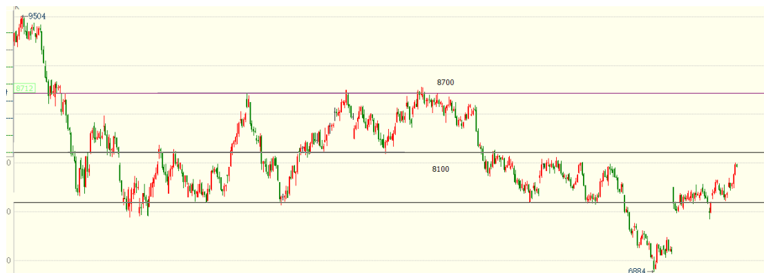
（棕榈油主力 01 合约 1h 图）