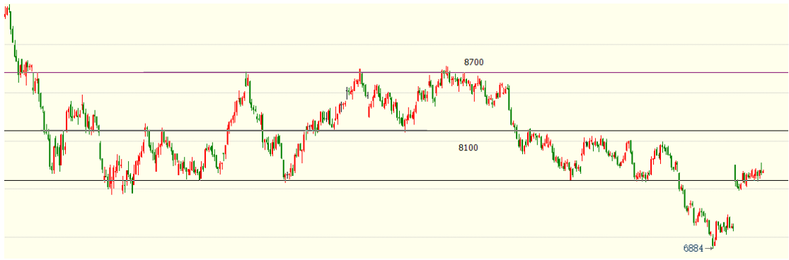
（棕榈油主力 01 合约 1h 图）