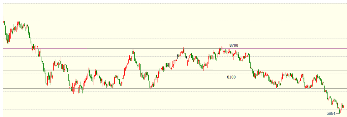
（棕榈油主力01合约1h图）

东南亚进入产量高峰期，棕榈油供应增加，需求端暂时难以支撑当下扩张的供应压力，棕榈油进一步承压下行。随着印尼进一步下调棕榈油出口价，10-11月船期有所增加，印尼库存进一步向需求国转移，我国国内后续到港压力依然存在，国内库存或进一步建立。在棕榈产地10月底的增产旺季结束前，若需求端不出现进一步明显改善，供需偏宽松的情况难以改变，整体以偏空思路对待。