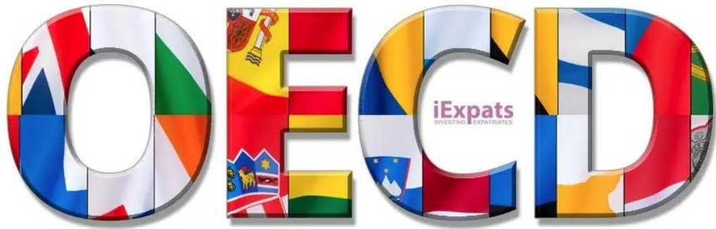
Organisation of Economic Co-Operation and Development