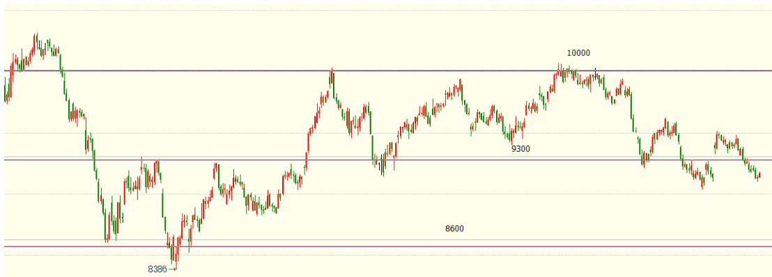
(豆油主力 01 合约 1h 图)

截至收盘，棕榈油主力收盘报7882元/吨，跌幅2.04%，持仓+7598手。豆油主力收盘报9170元/吨，跌幅1.97%，持仓+9639手。盘面上，豆油及棕榈油在美联储加息背景下，整体呈现回落态势，且供应方向仍存压力。随着消费国需求支撑，印尼高库存问题缓解，同时，进入四季度，棕榈油季节性供应将边际减弱，利于库存去化。棕榈油关注7500-8100的震荡行情；豆油关注9100-9600的震荡行情，尤其是筑底迹象，底部区间不宜过度看空，轻仓高抛低吸或观望为主。