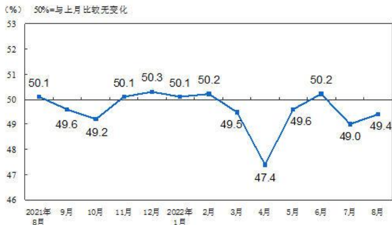
图2 非制造业商务活动指数（经季节调整）