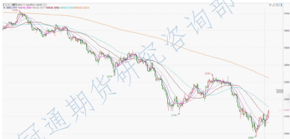
螺纹 2501 小时 K

投资有风险，入市需谨慎。 本公司具备期货交易咨询业务资格，请务必阅读最后一页免责声明。