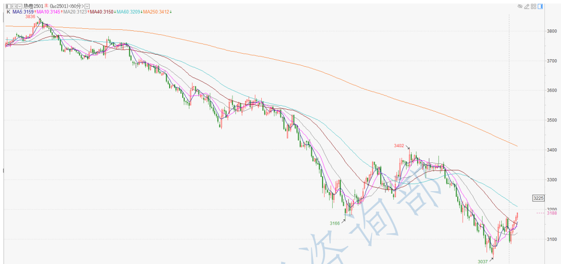
热卷 2501 小时 K