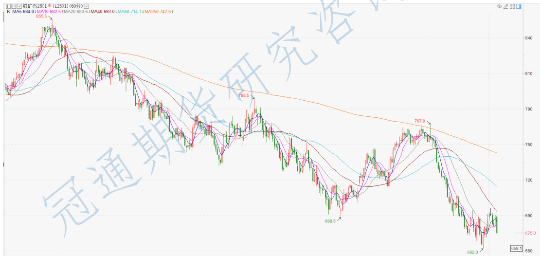
铁矿石 2501 小时 K