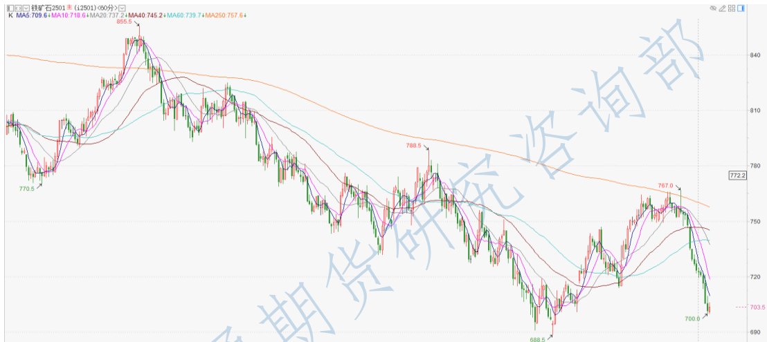
铁矿石 2501 小时 K