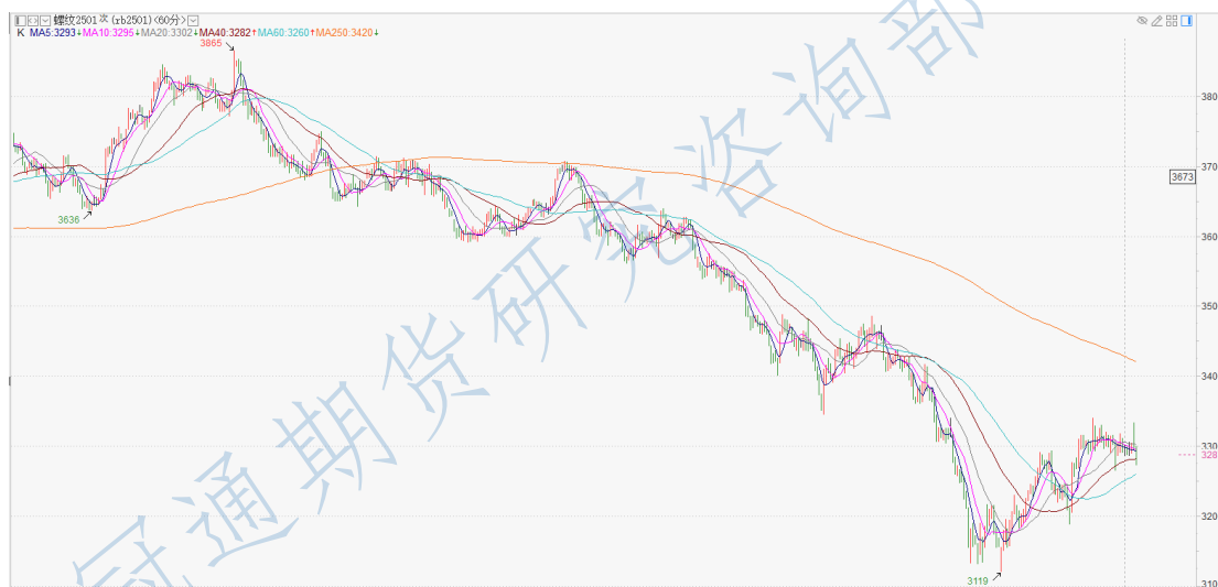
螺纹 2501 小时 K

投资有风险，入市需谨慎。 本公司具备期货交易咨询业务资格，请务必阅读最后一页免责声明。