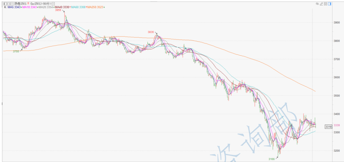
热卷 2501 小时K