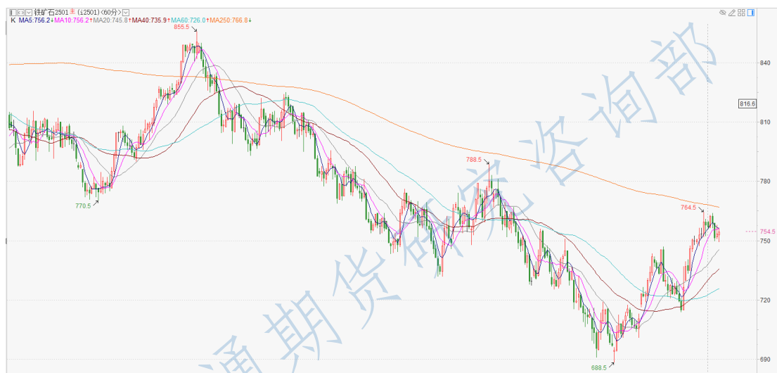
铁矿石 2501 小时 K