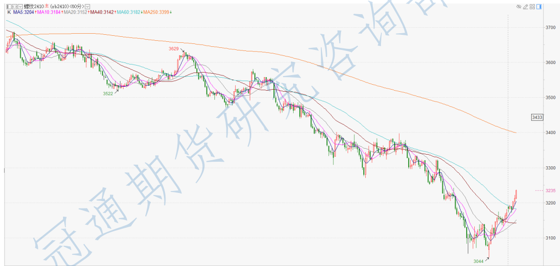
螺纹 2410 小时 K

投资有风险，入市需谨慎。 本公司具备期货交易咨询业务资格，请务必阅读最后一页免责声明。