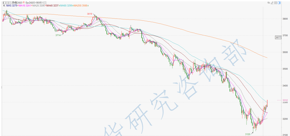
热卷 2410 小时 K