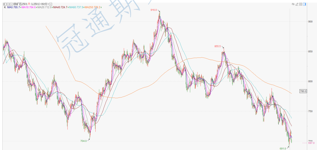
铁矿石 2501 小时 K