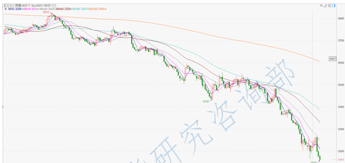
热卷 2410 小时 K