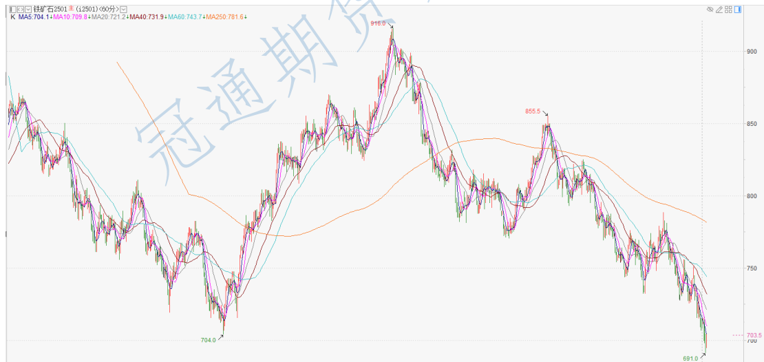
铁矿石 2501 小时K