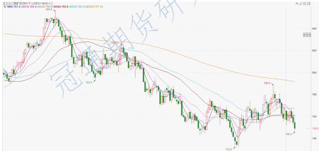
铁矿石 2501 小时 K