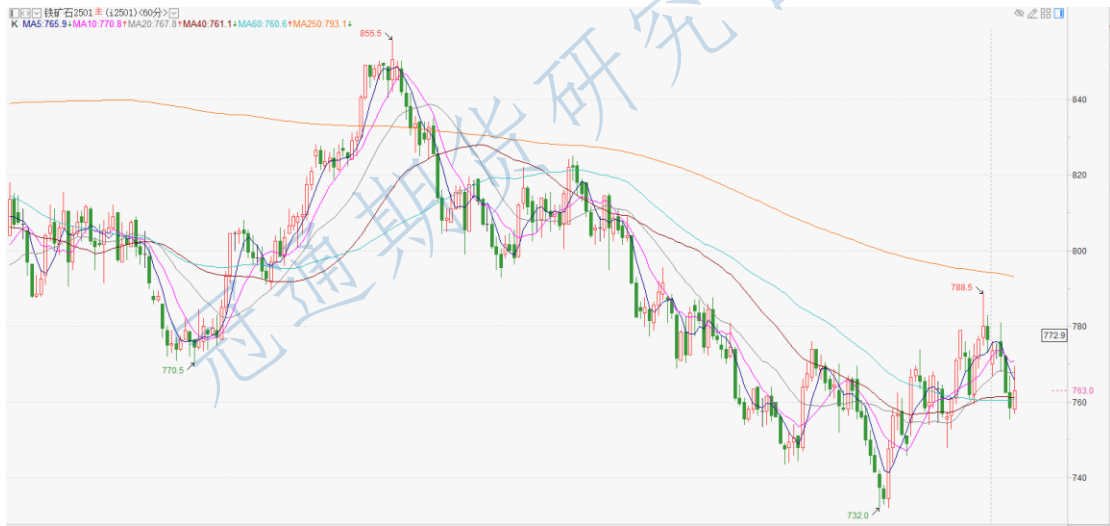
铁矿石 2501 小时 K