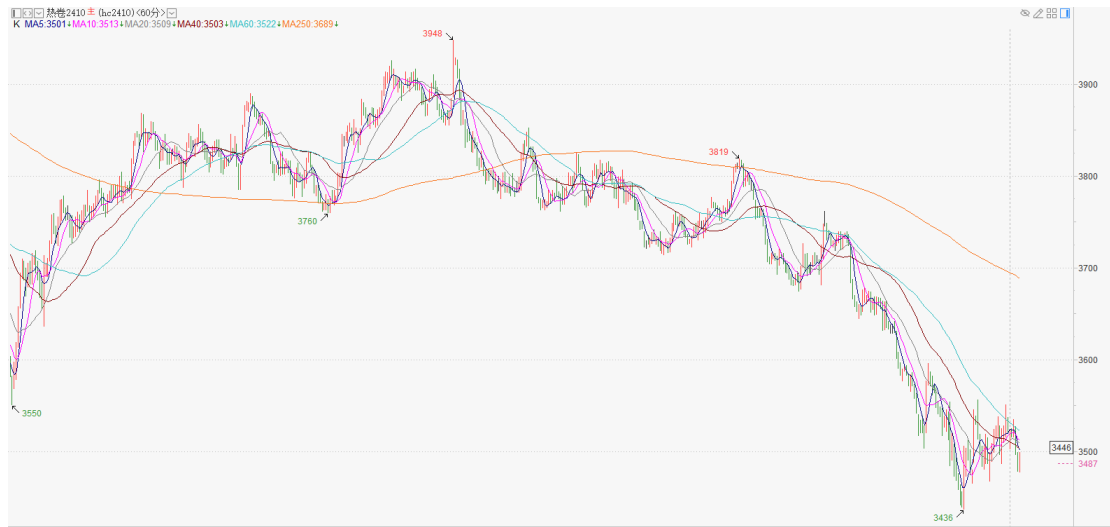
热卷 2410 小时 K