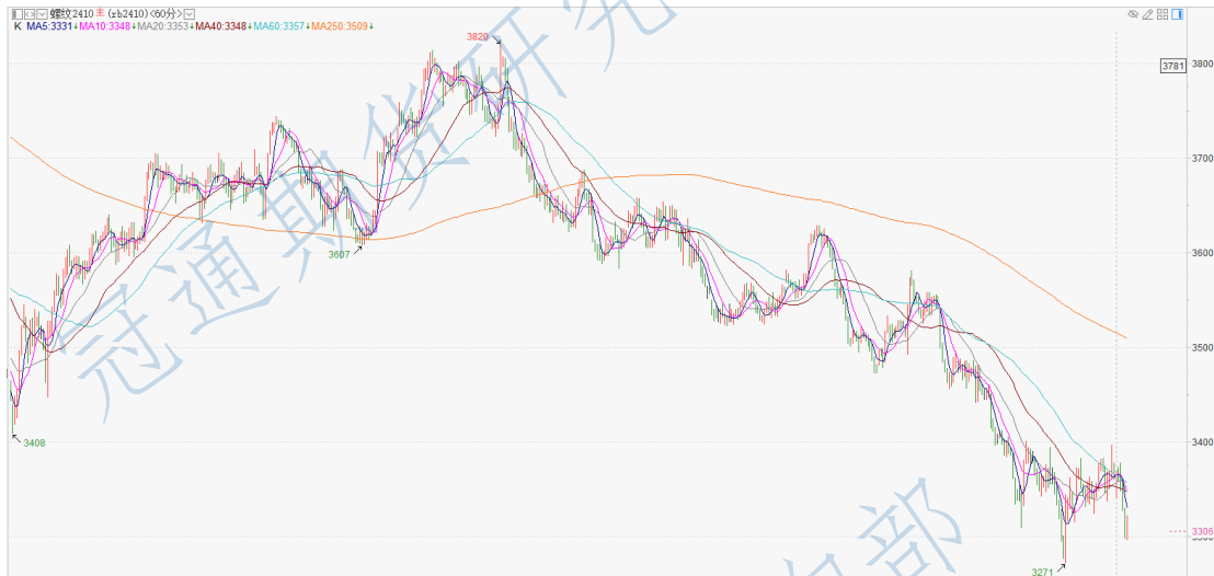
螺纹 2410 小时 K

投资有风险，入市需谨慎。 本公司具备期货交易咨询业务资格，请务必阅读最后一页免责声明。