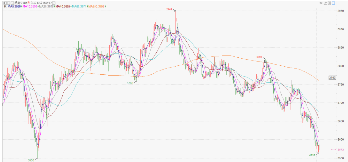
热卷 2410 小时 K