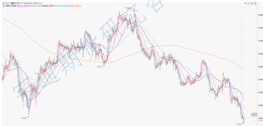
螺纹 2410 小时 K

投资有风险，入市需谨慎。 本公司具备期货交易咨询业务资格，请务必阅读最后一页免责声明。