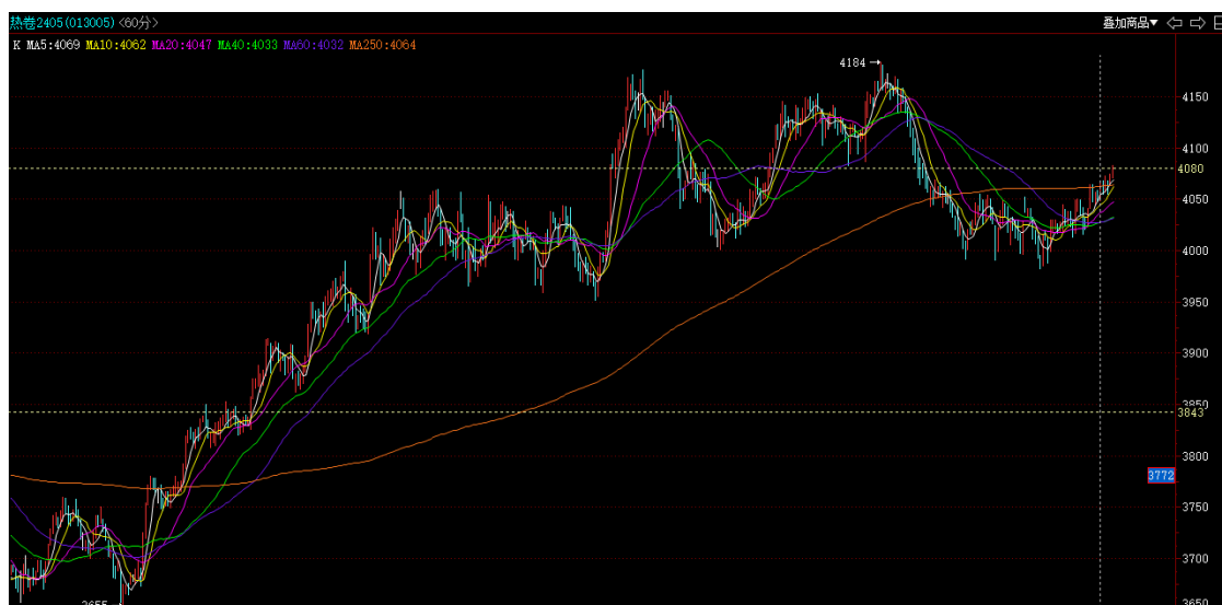
热卷 2405 小时线