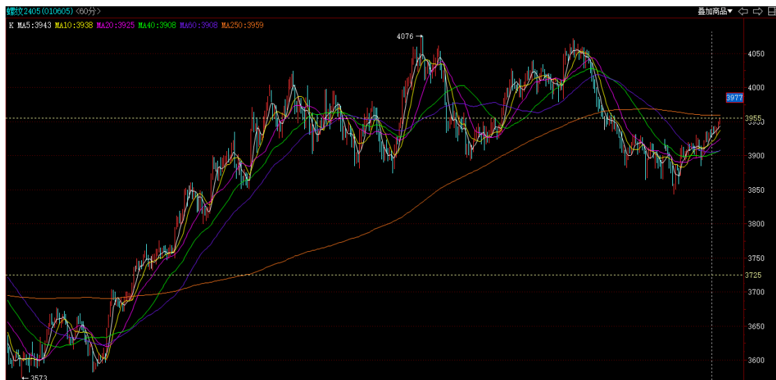
螺纹 2405 小时线

投资有风险，入市需谨慎。 本公司具备期货交易咨询业务资格，请务必阅读最后一页免责声明。