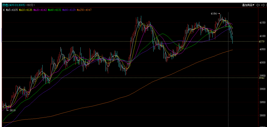
热卷 2405 小时线