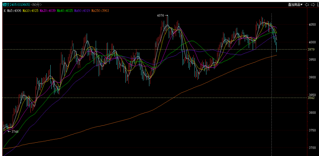
螺纹 2405 小时线

投资有风险，入市需谨慎。 本公司具备期货交易咨询业务资格，请务必阅读最后一页免责声明。