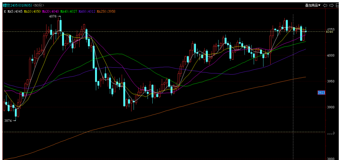
螺纹钢 2405 小时线

投资有风险，入市需谨慎。 本公司具备期货交易咨询业务资格，请务必阅读最后一页免责声明。