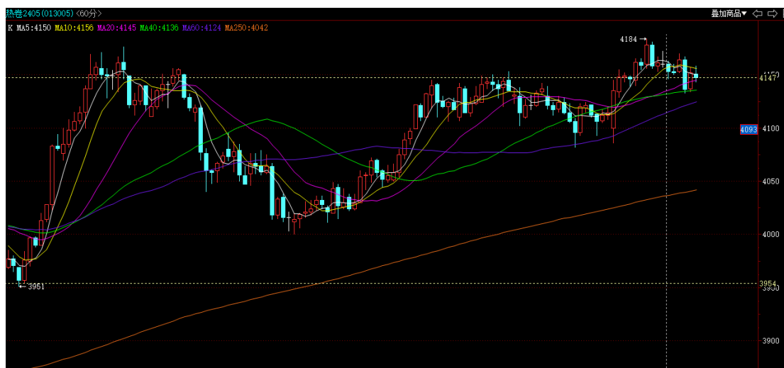
热卷 2405 小时线