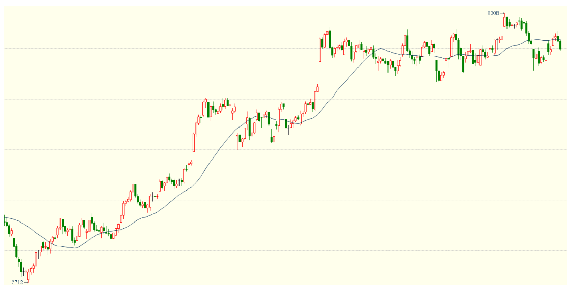
（豆油 09 合约 1h 图）