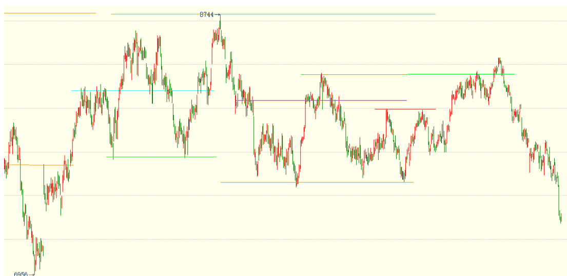
（棕榈油 05 合约 1h 图）