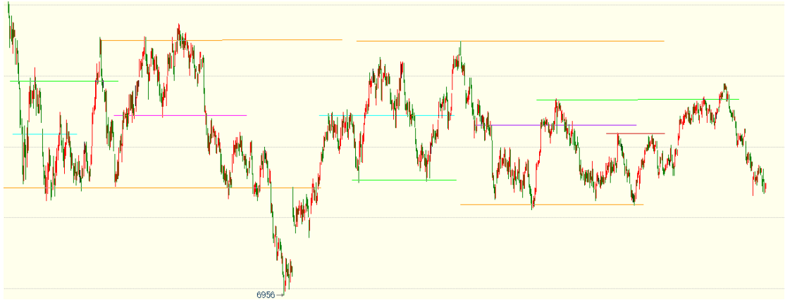
（棕榈油 05 合约 1h 图）