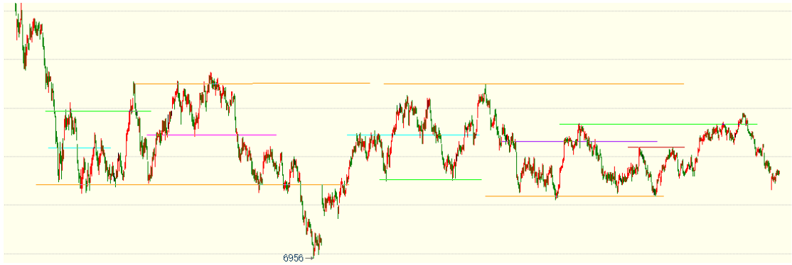
（棕榈油 05 合约 1h 图）