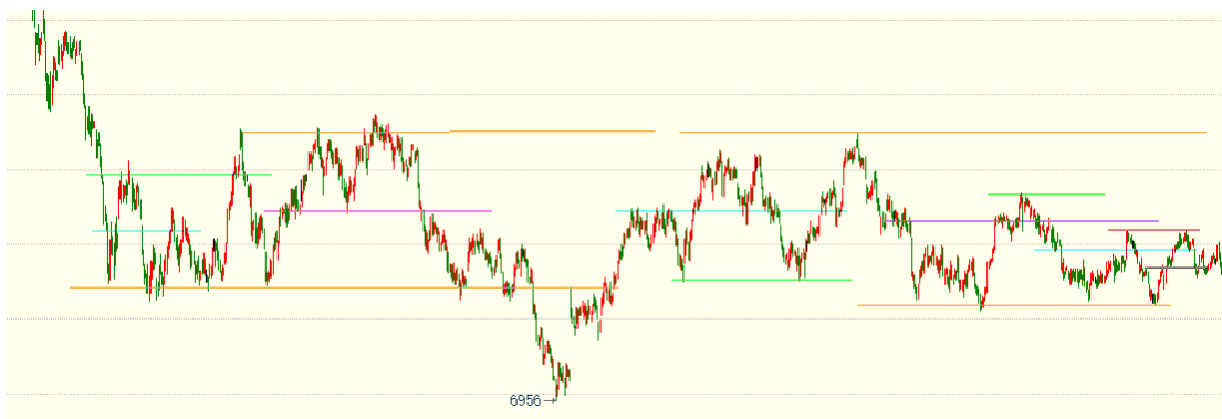
（棕榈油 05 合约 1h 图）