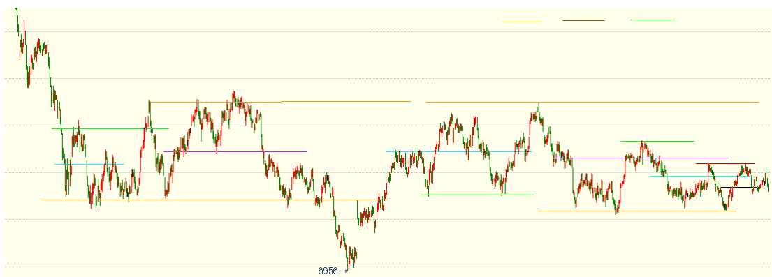
（棕榈油 05 合约 1h 图）