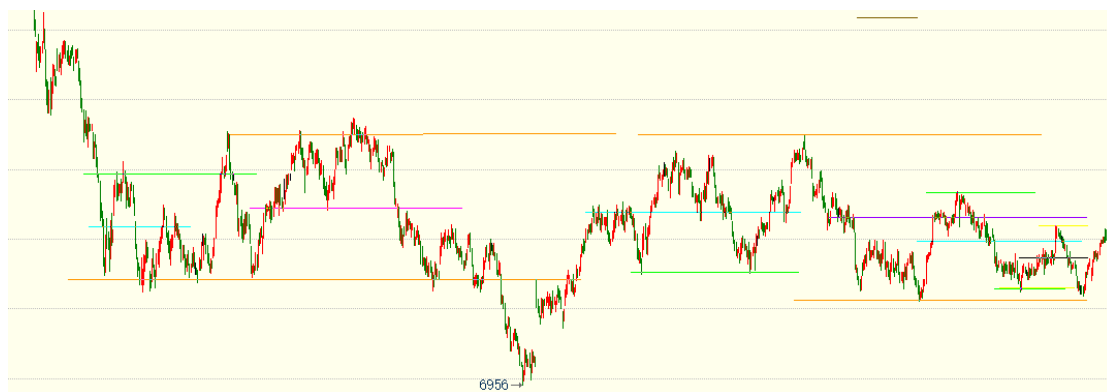
（棕榈油 05 合约 1h 图）

等待 MPOB 的报告指引。印尼确认提高国内销售义务，后续关注印尼是否对出口许可加以限制，以及其国内的需求情况对国际供应的影响。中国国内库存仍处高位，压力不减，但随着国内到港趋缓，及消费增加，库存压力料缓解。盘面上，棕榈油震荡偏强，关注 8100 的压力，逢高适量止盈，其余多单继续持有。