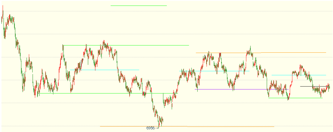
（棕榈油 05 合约 1h 图）