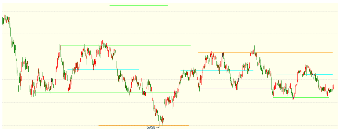
（棕榈油 05 合约 1h 图）