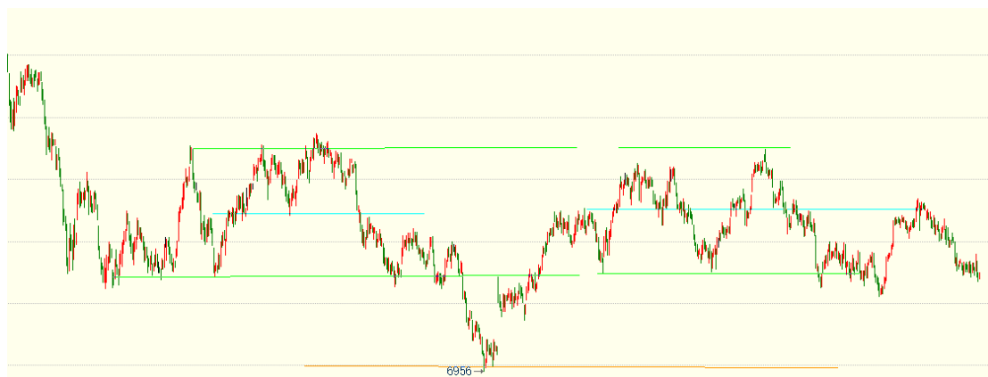
（棕榈油 05 合约 1h 图）

回击欧美的无端指控，马来计划停止向欧洲出口棕榈油，边际需求或继续转差，产地减产已成共识，马来 12 月供需报告显示，供给未有超预期回落，短期上行动能不足，盘面承压运行。中国国内库存仍处高位，1 月到港量回落，但国内需求尚未恢复到正常水平，库存去化能力相对有限，短期看库存高点已现，持续关注需求的修复表现。盘面上，棕榈油主力低位震荡，走势疲软，尚未打破宽幅震荡走势，关注区间低点支撑，前期多单少量持有，短线观望为主。